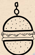
De Leidse Lente burger